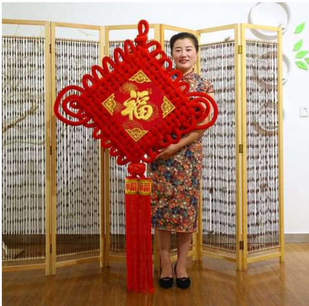
Китайский узел 中国结